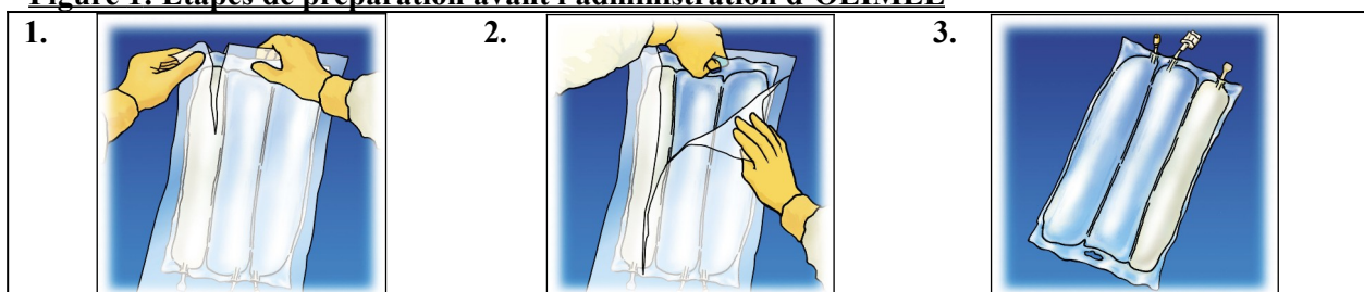
Figure 1: Étapes de préparation avant l'administration d'OLIMEL

Insérer fermement le perforateur du set de perfusion dans l'embout d'administration.