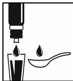
2. Tenir le